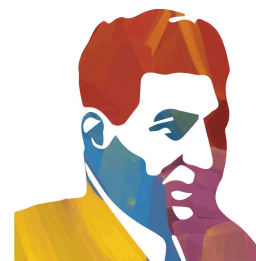
Bibliopoint Giuseppe Di Vittorio

Il Teatro Quirino-Vittorio Gassman propone in collaborazione con la rete delle Biblioteche di Roma il PROGETTO DI RECENSIONI dedicati agli Studenti delle scuole che ospitano il Biblio-Point